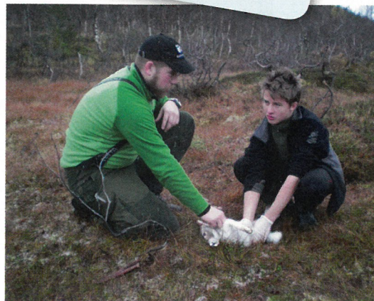
Reperum verum voluptat. Ipsuntus exerum harunti busapedit et oditatis id eat

Senja i Troms fylke er Norges nest største øy, med sine 1 586,3 km 2 og i underkant av 8 000 innbyg- gere. Øya kalles for et Norge i miniatyr. Senja har variert natur, og omfatter kommunene Berg, Torsken, Tranøy og deler av Len- vik.